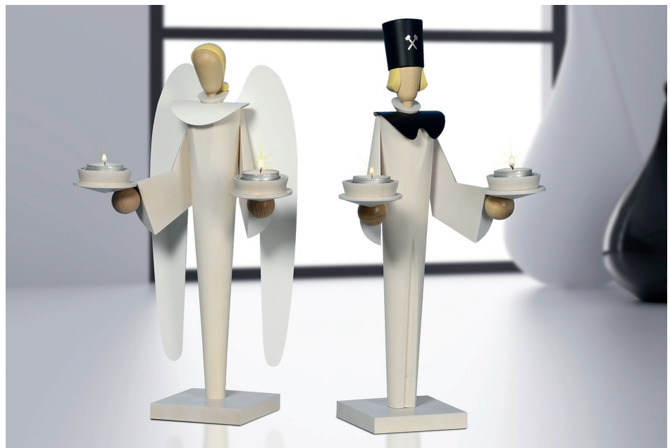
Engel und Bergmann setzt die KWO in diesem Jahr als Leuchter in reduziert klarer Formensprache um.

Weiß, nur von wenigen Akzenten in Natur oder Schwarz unterstrichen, ist die Farbe, die für die Leuchter Engel und Bergmann gewählt wurde. Sie sind durch ihre Attribute Flügel oder Bergmannshut erkennbar, verzichten aber sonst auf dekorative Details, die von